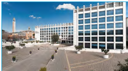
Hotel Barceló Aran Mantegna ★★★★★ Via Andrea Mantegna, 130 - 00147 Roma RM